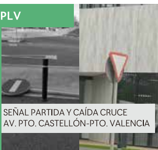
SEÑAL PARTIDA Y CAÍDA CRUCE AV. PTO. CASTELLÓN-PTO. VALENCIA