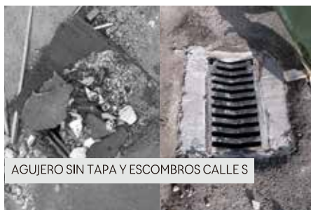
AGUJERO SIN TAPA Y ESCOMBROS CALLE S