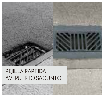
REJILLA PARTIDA AV. PUERTO SAGUNTO