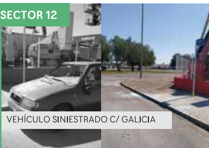
VEHÍCULO SINIESTRADO C/ GALICIA