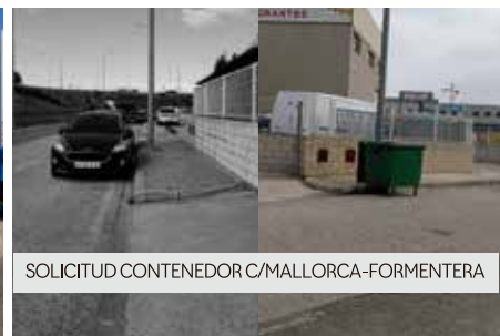
SOLICITUD CONTENEDOR C/MALLORCA-FORMENTERA