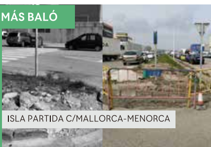
ISLA PARTIDA C/MALLORCA-MENORCA