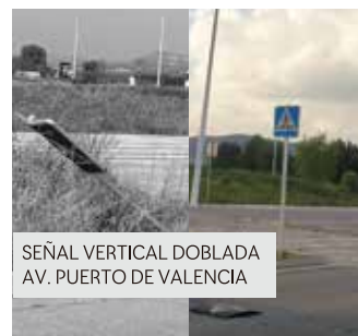
SEÑAL VERTICAL DOBLADA AV. PUERTO DE VALENCIA