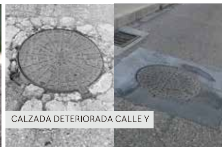
CALZADA DETERIORADA CALLE Y