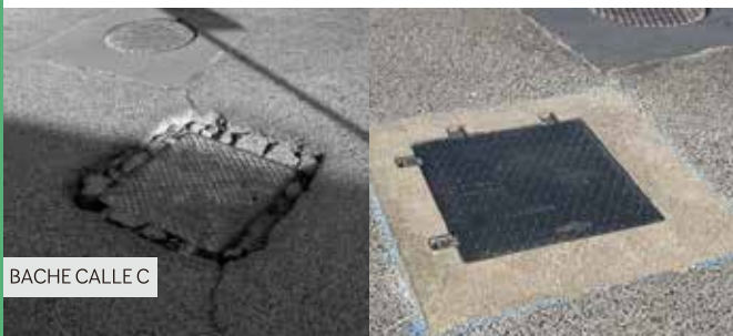
BACHE CALLE C