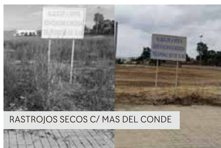
RASTROJOS SECOS C/ MAS DEL CONDE