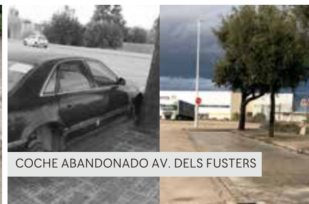
COCHE ABANDONADO AV. DELS FUSTERS