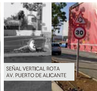
SEÑAL VERTICAL ROTA AV. PUERTO DE ALICANTE