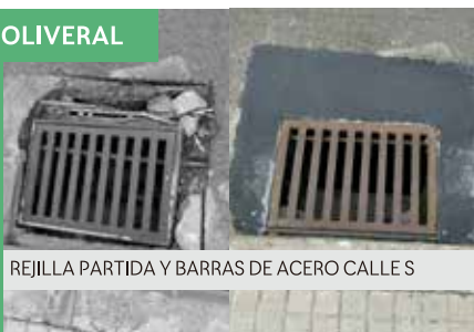
REJILLA PARTIDA Y BARRAS DE ACERO CALLE S