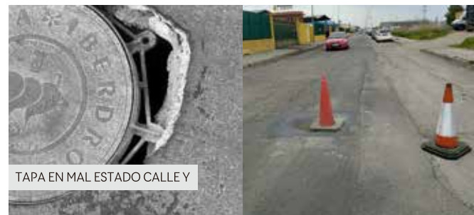
TAPA EN MAL ESTADO CALLE Y