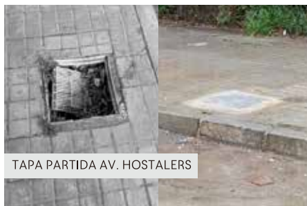
TAPA PARTIDA AV. HOSTALERS