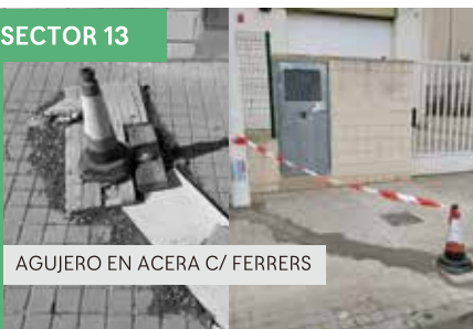
AGUJERO EN ACERA C/ FERRERS