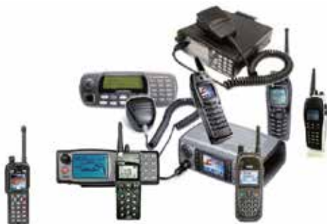
>>> Diferentes modelos de terminal TETRA

Redes de comunicaciones Wifi / WiMAX con cobertura en todo el Polígono. O bien con soluciones individualizadas para cada empresa o bien con soluciones o redes compartidas por las empresas de la asociación.