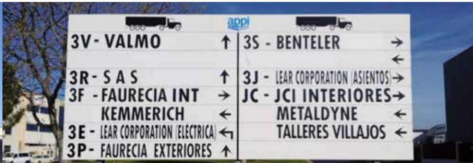
Cartel señalización muelles empresas