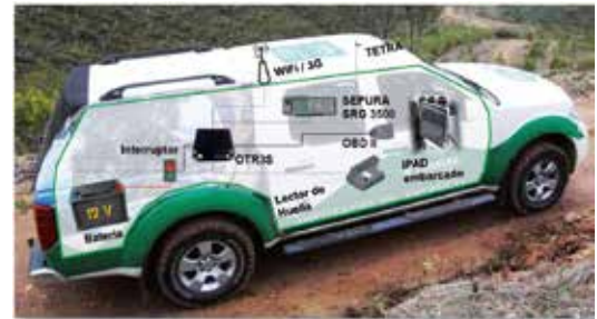
>>> Ejemplo de instalación en vehículo

También puede ser compartida por las empresas de la asociación. Este tipo de redes permite la comunicación de voz y datos en modo encriptado e independiente de la telefonía de los operadores, no siendo afectada por sus típicas saturaciones en caso de emergencia.