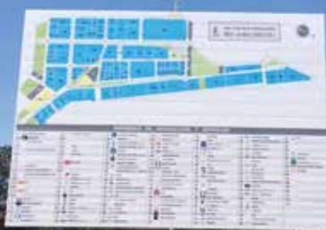
Mapa señalización empresas Parque