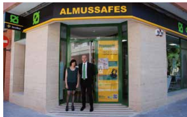
Nueva oficina en la localidad de Almussafes

Caixa Popular es una cooperativa de crédito valenciana con más 60 oficinas. Su Oficina de Almussafes, situada en la calle Lira Almussafense N° 11 abre, como todas las oficinas de la entidad, todos los días mañana y tarde.