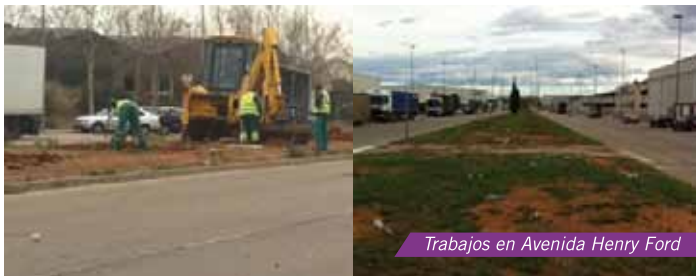
Trabajos en Avenida Henry Ford

Una de las principales reivindicaciones de la APPI referentes al Ayuntamiento de Picassent, en los últimos meses, ha sido la falta de mantenimiento de las zonas ajardinadas ubicadas en su término municipal. Con el objetivo de conseguir mejoras en estos aspectos, la APPI se reunió el pasado mes de febrero con representantes del Consistorio que se comprometieron a trabajar en esta dirección. Y efectivamente ya se han puesto en marcha acciones de limpieza, acondicionamiento y mantenimiento de las zonas ajardinadas en diferentes áreas de su competencia.