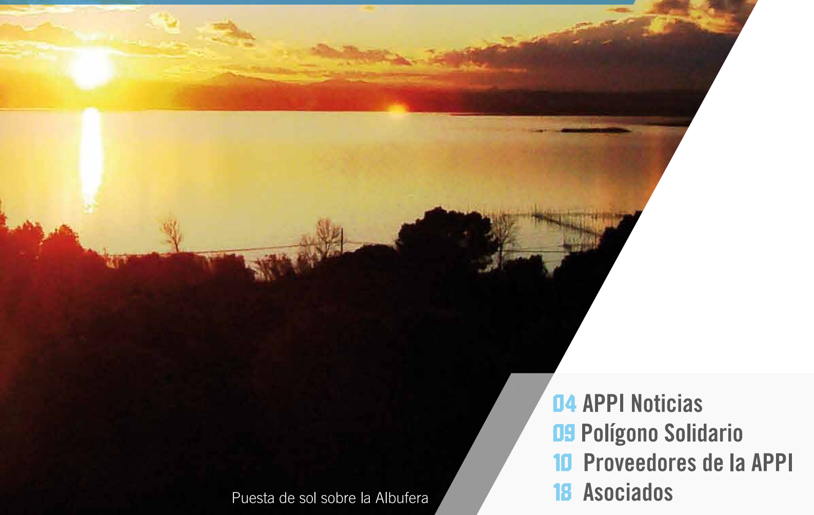
Puesta de sol sobre la Albufera

En tus manos tienes una de las novedades de nuestra asociación, el segundo número de la revista corporativa de la APPI . Una apuesta por dar visibilidad a las empresas, trabajadores y acciones que tienen lugar dentro del Parque Industrial Juan Carlos I .