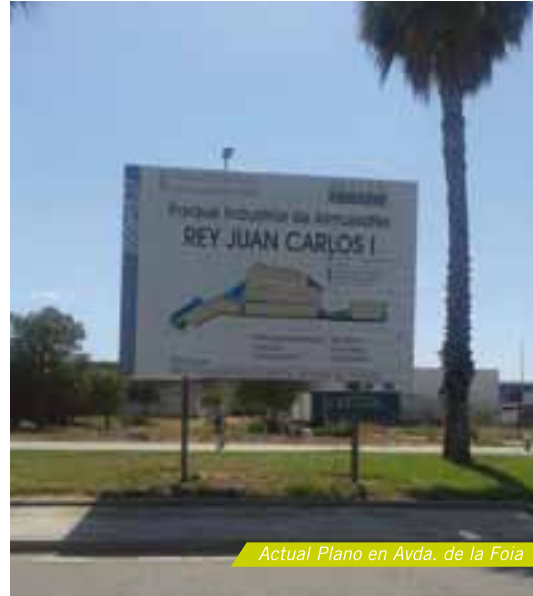
Actual Plano en Avda. de la Foia

Le rogamos que nos envíe todos estos datos a la siguiente dirección: info@appi-a.com .