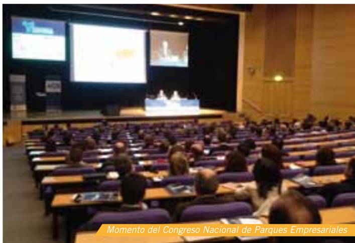
Momento del Congreso Nacional de Parques Empresariales

Durante la jornada tanto expertos como ponentes expusieron diferentes puntos de vista sobre la