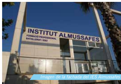
Imagen de la fachada del IES Almussafes

Las empresas interesadas en participar el próximo curso, septiembre 2014, con algún alumno de formación dual, es necesario que contacte con el centro de formación profesional con el que suelas trabajar, ya que se deberá definir el programa formativo y presentar la solicitud antes del 30 de abril de 2014.