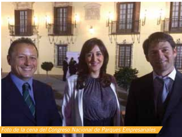
Foto de la cena del Congreso Nacional de Parques Empresariales