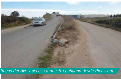
Puente sobre las líneas del Ave y acceso a nuestro polígono desde Picassent

La APPI se ha posicionado, junto con la Generalitat, a favor de la mejora de esta conexión con el Polígono La Coma como respuesta más inmediata a la falta de espacio en el Parque Industrial Juan Carlos I, mientras se estudia la posibilidad de una tercera fase de su ampliación.