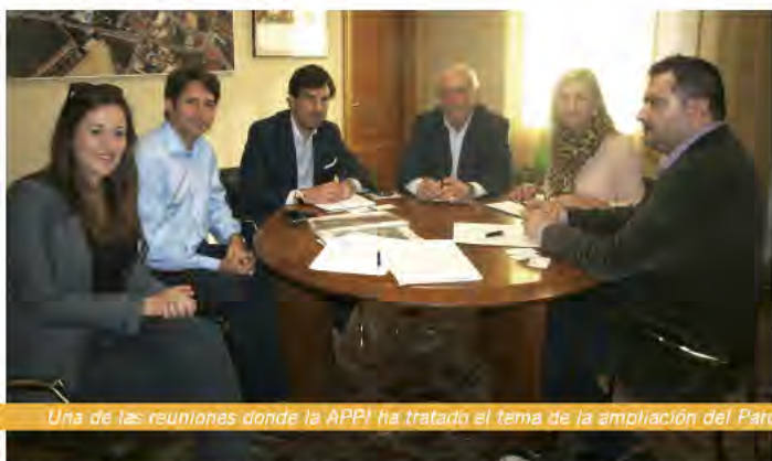
Una de las reuniones donde la APPI ha tratado el tema de la ampliación del Parque

Desde el momento que el volumen solicitado sea considerado suficiente para lanzar el proyecto de urbanización, se estiman alrededor de 36 meses para la ejecución de todas las fases necesarias. El problema surge como consecuencia de que dichos plazos no cubrirían las necesidades actuales de espacio, por lo que muchas empresas están valorando ubicar sus instalaciones y/o almacenes en los polígonos vecinos, como el de Picassent.